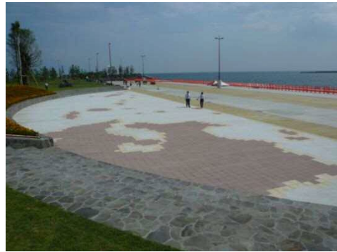
シラスコンクリート装飾板の施工例