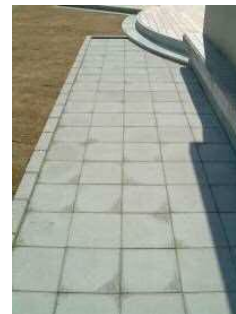
シラス加圧成形体の施工例