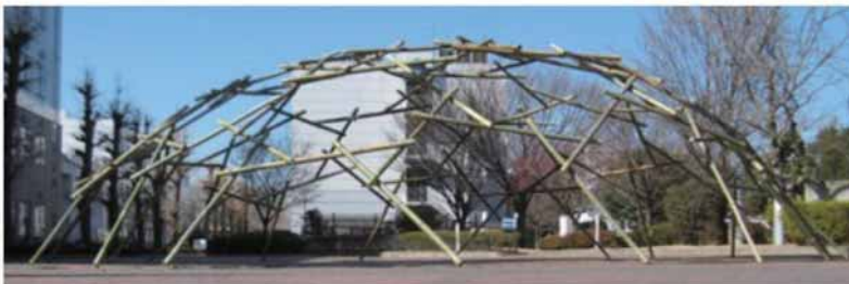
短材を利用した竹ドーム スパン8m (2011)