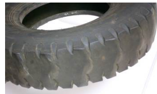
多角形化したタイヤ