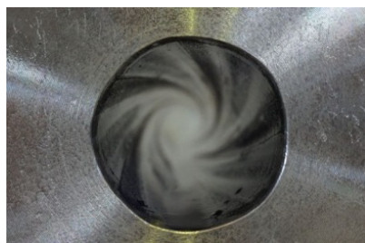
ライフリングマーク【1】