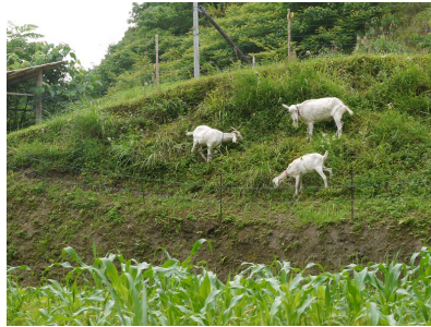
傾斜地でのヤギ放牧