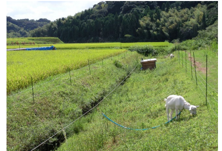
水田畦畔でのヤギの繋牧