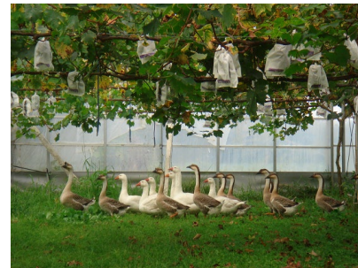
ブドウ園でのガチョウ放飼