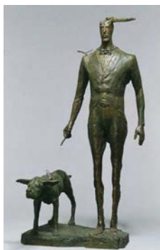
「ホルテラの詩人」(2010年・日展)