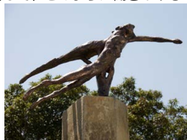
「出会い」(2008年・志布志市)

<ルーマニア・トゥルグジウ市>ブランクーシ国際彫刻シンポジウムに招待され、「DORAG OBETE」像を設置（平成20年）